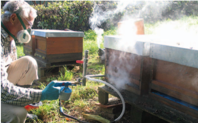
Abb.1: Imkers Spieltrieb: „Oxalsäure verdampfen“ ist Technik pur, macht daher offenbar vielen Spaß. Doch sicherer für Bienen und Imker, einfacher, schneller und unschlagbar günstig ist „Oxalsäure träufeln“.