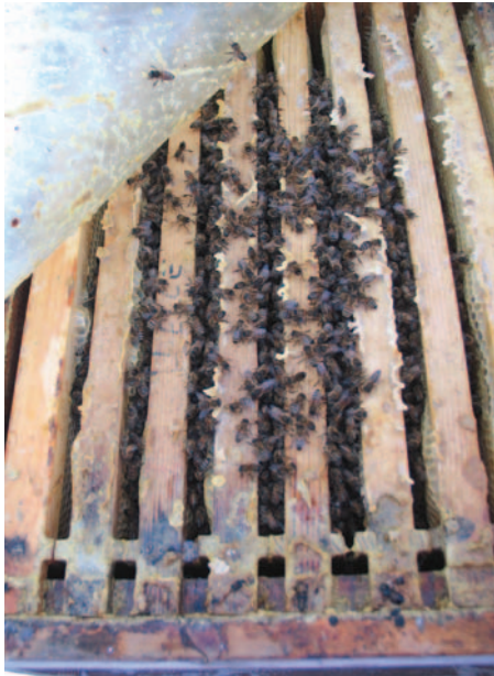
Abb.4: Einzarger werden von oben behandelt. Deckel und Folie ab, Spritze aufziehen, Anzahl besetzter Wabengassen ermitteln (hier 7 minus 2 = 5) und 50 ml Lösung träufeln.

Für die besonders wichtige Entmilbung vor dem Ausbrüten der Winterbienen im September ist eine geeignete Ameisensäurebehandlung deutlich sicherer und einfacher. Für die Restentmilbung im Spätherbst / Winter jedoch, ist „Oxalsäure träufeln“ optimal, da unbedenklich für Bienen und Anwender, einfach, rückstandsfrei und sicher. So starten die Völker milbenarm ins neue Jahr.