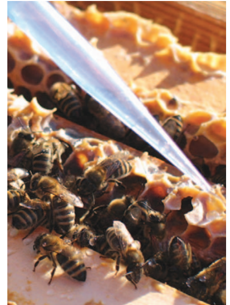
Abb.8a-c: Zwischen 30 und 50 ml Lösung werden durch mehrmaliges Abfahren der besetzten Wabengassen direkt auf die Bienen verteilt.