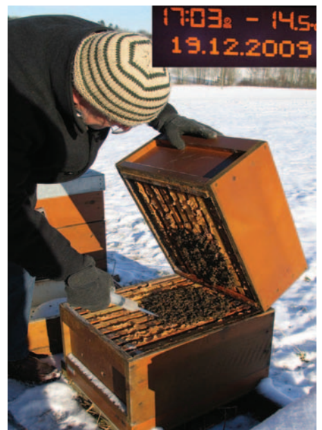
Abb.6: Je kälter der Behandlungstag, desto besser wirkt die Oxalsäurelösung. Die Bienen stört die kurze Lüftung nicht.

In der eng sitzenden Wintertraube liegt der Erfolg der einmaligen Behandlung bei über 95%. In der „Sommertraube“ kann er weit unter 50% liegen, auch wenn keine Brut vorhanden ist und alle Milben auf den Bienen sitzen. Deshalb ist das Träufelverfahren nur für die Behandlung der Wintertraube zu emp-