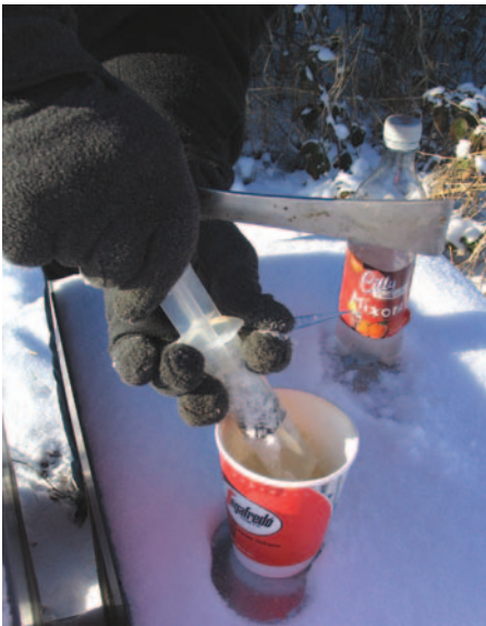
Abb.7: Oxalsäurelösung muss nicht gewärmt werden. Wenn benötigt, wird sie in einen Becher umgegossen und von dort in die Spritze aufgezogen. Die Sprizentülle erst danach aufstecken.

Die Winterbehandlung löst einen Milbenfall aus, der am nächsten Tag einsetzt, am zweiten, dritten oder vierten Tag seinen Höhepunkt erreicht und zwei bis vier Wochen anhält. Wer genau wissen will, wie viele Milben durch die Behandlung getötet wurden, muss die Windel vier Wochen lang unter dem Volk lassen.