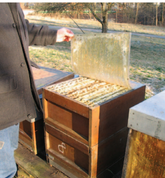
Abb.5 a-b: Zweizarger sitzen vor Weihnachten meist unten. Dann wird nicht blind von oben in die Wabengassen geschossen, sondern die obere Zarge angekippt. Das geht bei Frost auch ohne Rauch und schadet den Bienen nicht.

Für die besonders wichtige Entmilbung vor dem Ausbrüten der Winterbienen im September ist eine geeignete Ameisensäurebehandlung deutlich sicherer und einfacher. Für die Restentmilbung im Spätherbst / Winter jedoch, ist „Oxalsäure träufeln“ optimal, da unbedenklich für Bienen und Anwender, einfach, rückstandsfrei und sicher. So starten die Völker milbenarm ins neue Jahr.