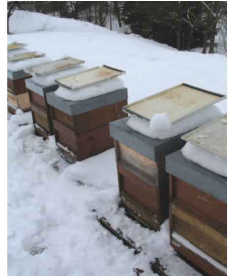
Abb.2: Eine Gemüldiagnose über 3-5 Tage gibt Aufschluss über den Befallsgrad des Volkes. Fallen mehr als eine Milbe pro Tag, ist eine Behandlung dringend anzuraten.

Nie wieder Lust auf Winterverluste? Junge Königinnen, sauberes Wabenwerk, geeignetes Winterfutter und ausreichend starke Völker sind das Erfolgsrezept. Und essentiell: ein erfolgreiches Behandlungskonzept gegen Varroa. Es steht auf vier Säulen: der Bildung von Ablegern, der mehrmaligen Entnahme von Drohnenbrut im Mai/Juni, der Behandlung mit Ameisensäure vor und nach der Auffütterung im August/September und der Oxalsäurebehandlung im Spätherbst oder Frühwinter.