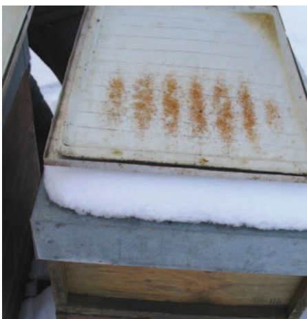
3a: gutes Volk, sitzt bei Frost über 5 Wabengassen (2 Randgassen werden abgezogen, da dort nur wenige Bienen sitzen). Hier können 50 ml Oxalsäurelösung verabreicht werden.